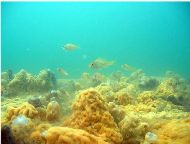
増殖場に集まったメバル稚魚

この成果を活用し、豊前海では平成19年度から柄杓田地区と恒見地区で根魚の増殖場造成事業が行われ、多くの根魚の増殖がみとめられています。