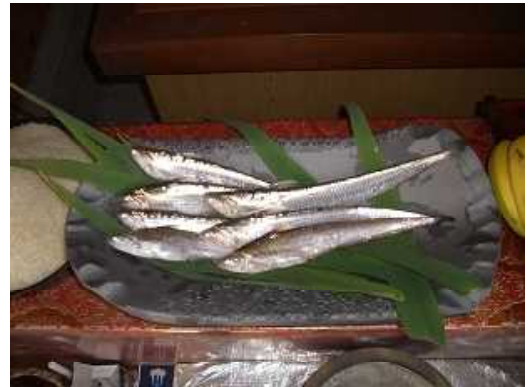
筑後地方の特産魚「エツ」

このため、下筑後川漁協ではエツの種苗生産、放流による資源増殖に取り組んでおり、研究所では、その効果を高めるため、種苗の増産、活力の向上に関する技術開発を行いました。