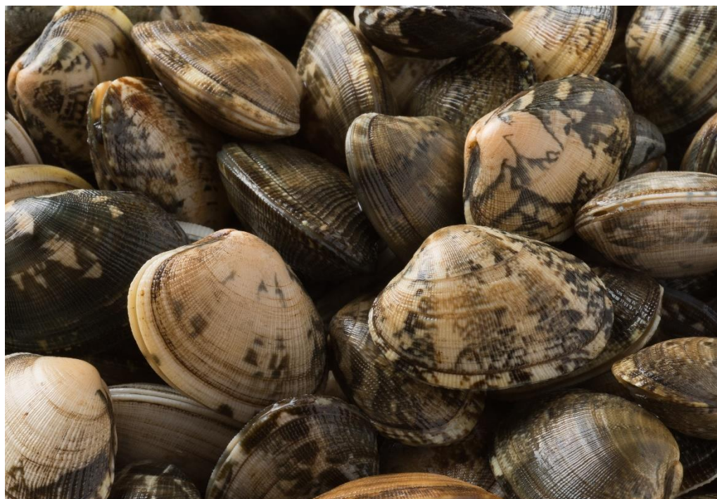
有明海で水揚げされたアサリ