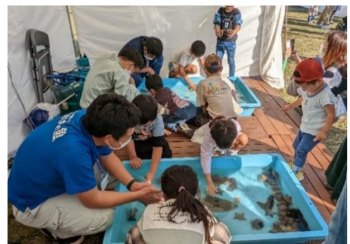
タッチングプール