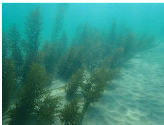
漁場で生長したアカモク

アカモク養殖は、漁場に設置してから収穫までの管理作業が少なく、養殖期間が約 3 ヶ月と短期間であることが特徴です。今後も産地と連携して技術開発に取り組み、普及に努めていきます。