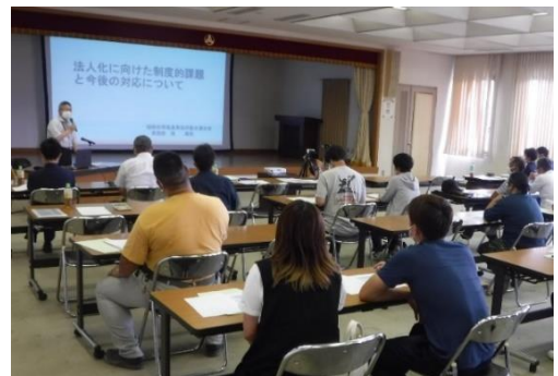
法人化セミナーの様子