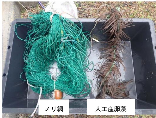
ノリ網と人工産卵藻