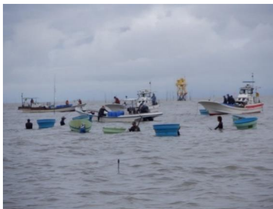
河口に近い漁場での採捕状況

これらの取組により、令和 3 年の春に 247 トンであったアサリ資源量が令和 4 年の秋には 791 トンまで回復し、今後の漁獲が期待されるようです。